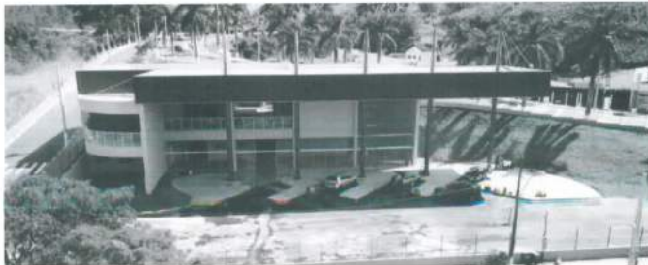
Nova Rodoviária

Por Guilherme Vilas Boas - 22 de agosto de 2018