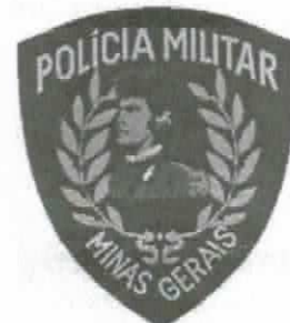
Brasão da PMMG